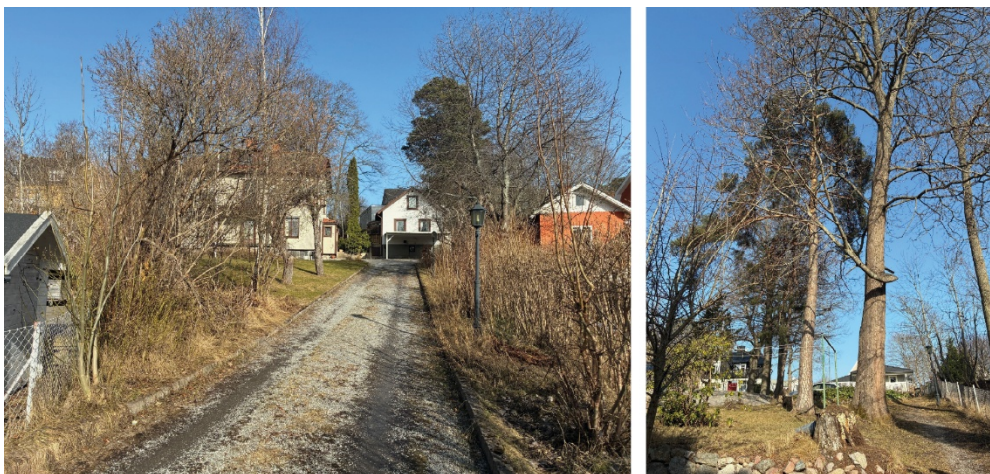
Bild 4. Till vänster: fastigheten sedd från Fenjavägen med vy norrut. Till höger: fastigheten med vy norrut mot Ekeby skogsväg.