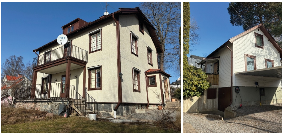
Bild 3. Befintlig huvudbyggnad till vänster, komplementbyggnad till höger.

Marken inom fastigheten är i låg utsträckning hårdgjord och består av gräsplanterade ytor, träd, buskage och grusade ytor för angöring. Trädgårdsmiljön består av anlagda ytor mot söder, med fruktträd, större gräsade ytor och grusad infart. På fastighetens norra del mot Ekeby skogsväg är trädgårdsmiljön mer naturlig med större träd, buskage och mer oregelbunda marknivåer. Här finns en större skogslönn med en stamdiameter på 75 cm som av kommunens förvaltningar bedöms inneha ett stort värde för biologisk mångfald. Flera övriga träd i fastighetens norra del bedöms även bevarandevärda, så som en tall, ett lärkträd och två ekar.